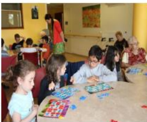
Des diamants en guise de jetons !